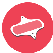
SERVIETTES LAVABLES NEUVES