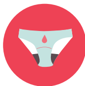
CULOTTES MENSTRUELLES NEUVES

Les paquets entamés et produits en vrac sont acceptés à condition qu'ils soient emballés individuellement.